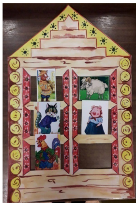
Рис. «Расскажи любимую сказку»