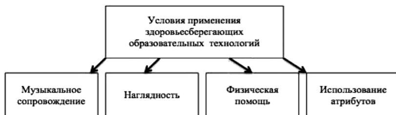
Рис. 1. Условия применения здоровьесберегающих образовательных технологий

Кроме того, было отмечено, что наиболее эффективно использовать здоровьесберегающие образовательные технологии при выполнении условий, указанных на схеме (рис. 1):