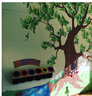
Рис. 1. Пространство Тифлоцентра

При организации коррекционно-развивающей среды нами были учтены: